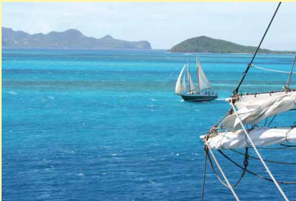
Erlebnispädagogik: High Seas High School - Das segelnde Klassenzimmer. Seit 1993 ein Segelprojekt des Internatsgymnasiums Hermann Lietz-Schule auf Spiekeroog

Das Internat Hermann Lietz-Schule auf Spiekeroog kann durch seine reformpädagogischen Grundsätze und die einzigartige Lage auf der Nordsee-Insel mitten im Weltnaturerbe Wattenmeer viele Naturbezüge direkt herstellen. Ergänzt wird dies mit praktischen Arbeiten in Gilden, wie der Gartenbaugilde, der Tierhaltungsgilde oder dem Deichbau. In den Gilden beteiligen sich die Internatsschü-