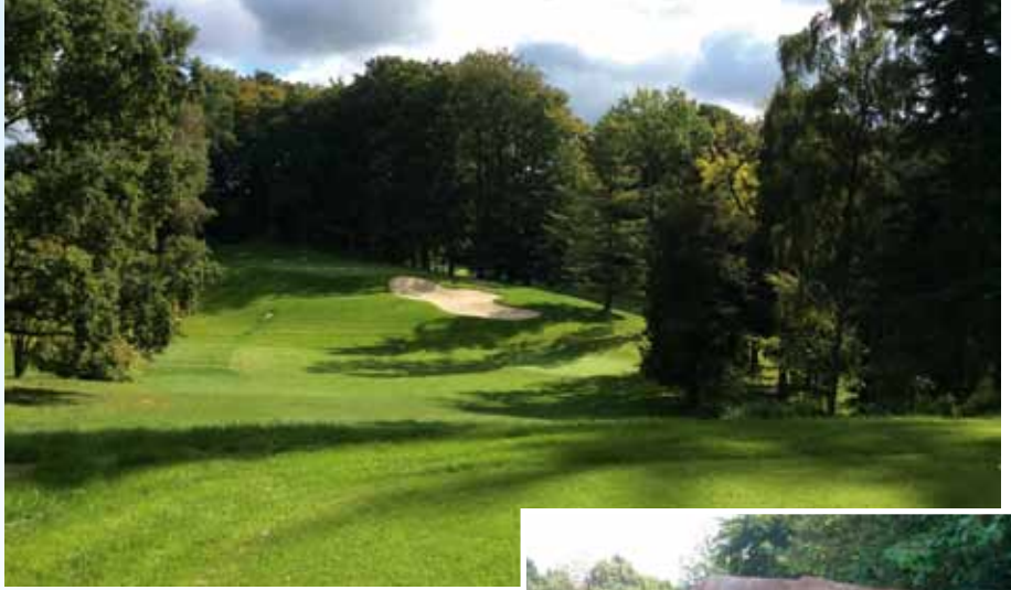
Loch 8 nach der Renovierung

Und dieses Gefühl, einen herausfordernden Platz gespielt zu haben, wird ausgelöst durch große ondulierte Grüns, durch perfekt platzierte Bunker und durch strategisch verbesserte Wasserhindernisse. Aus ehemaligen kleinen „Tümpeln“ wurden spielbeeinträchtigende Hindernisse, die zudem Fauna und Flora neue Lebensbereiche eröffnen. Leicht veränderte Fairwaykonturen bringen neue Spielsituationen, und das komplett verlegte 8. Loch (Foto) ist eine Verneigung vor der Natur und wird zu einer Herausforderung für Mitglieder und alle Walddörfer Gäste. Wir alle sind neugierig darauf, wie sich der Course spielen wird und was man alles an Veränderungen entdeckt und bewusst wahrnimmt. So auch den tonnenschweren Findling, der durch die Renovierungsmaßnahmen ans Tageslicht befördert wurde und nun auf der