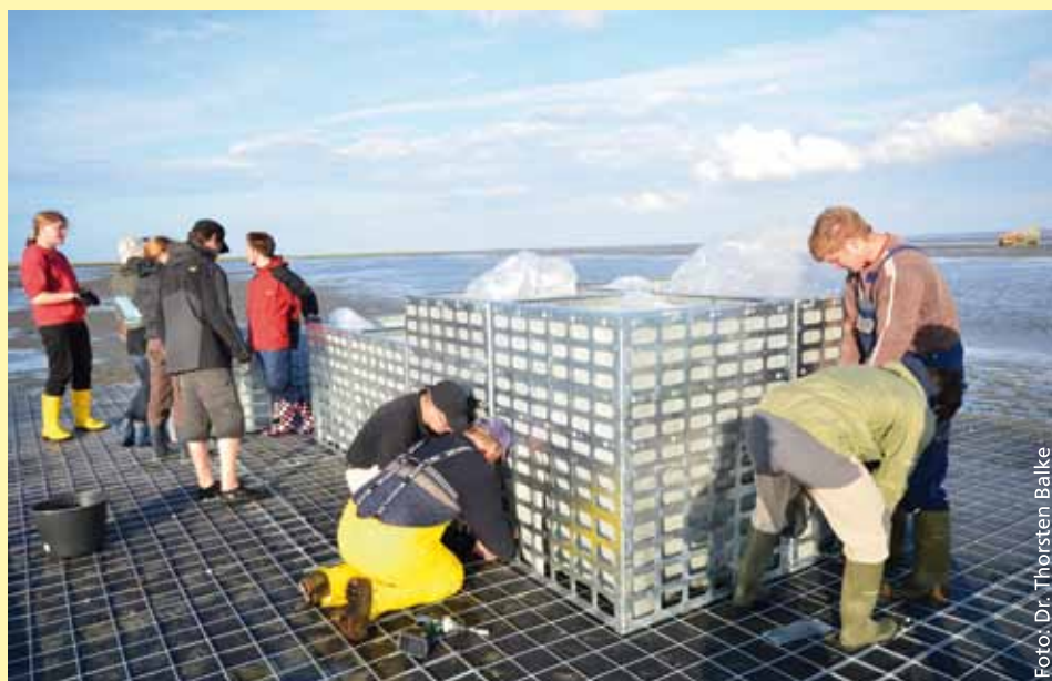
Aufbau von 12 experimentellen Inseln im Wattenmeer vor Spiekeroog – einem Forschungsprojekt der Uni Oldenburg und Göttingen, angegliedert am Forschungszentrum im schuleigenen Nationalpark-Haus Wittbülten der „Lietz“ Spiekeroog