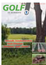
Titelfoto Hoisdorf Bahn 1

Augenblick mal! Lange hatte unser Sport ein schlechtes Image: großer Flächenverbrauch, zu viel Chemie. Doch ein längst vollzogener Paradigmenwechsel ist heute Realität: Das Schlagwort Nachhaltigkeit sitzt in den Köpfen und wird gelebt. Damit punktet der Golfsport in Sachen Umweltschutz. Wir als Spieler können ebenso zur nachhaltigen Pflege beitragen. Wie? Das Ausbessern einer Pitchmarke z. B. dauert Sekunden. Multipliziert man diese Sekunden mit 18 Löchern, wendet man im Verhältnis zur Spieldauer einer Runde nur ein Minimum an Zeit auf, verhindert aber die Schadstellen auf den Grüns. Mit dem Aufruf „Augenblick mal“ sollten alle Mitspieler die Pitchmarken ausbessern, und zwar vor dem Putten. Wäre das Ausbessern selbstverständlich, könnte die Schar guter Golfer rasch ansteigen, und jeder hätte seinen Umwelt-Beitrag geleistet. EJH