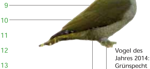
Vogel des Jahres 2014: Grünspecht