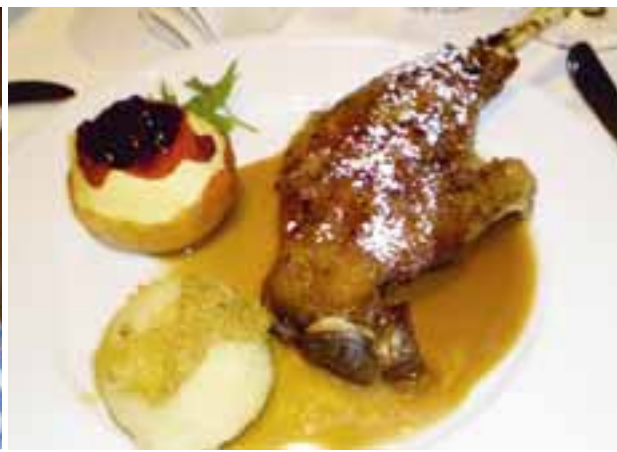
Begehrte Köstlichkeiten beim Oktoberfest und der Martinsgans