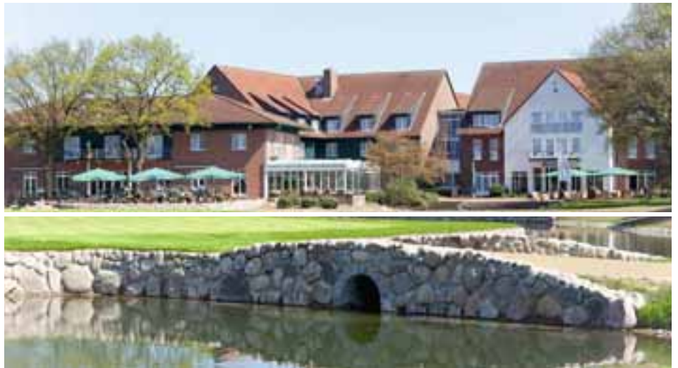
Das Schlussloch erreicht man über die Brücke

Anfang Juni waren unsere neuen Neuen endlich für alle bespielbar. Nach einer Preview für die schreibende Zunft am 13. Mai konnten nun alle Mitglieder den Platz bespielen und sich ihre Meinung bilden, die aufgrund der Wasserhindernisse gespalten ist. Wir sind jedoch unglaublich stolz auf den Platzzuwachs. Nicht zuletzt, weil nun auch an Turniertagen immer eine Spielmöglichkeit gegeben ist. Und Turniertage brachte der Juni einige: Am 5. Juni gab es den Hamburger Medien Cup, und der Damennachmittag stand ganz im Zeichen der Farbe Pink, da er zugunsten der „Happy for Life e.V.“, einer privaten Initiative zur Bekämpfung des