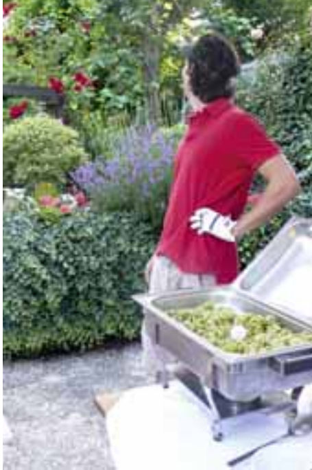
Im Nudeltopf eingelocht