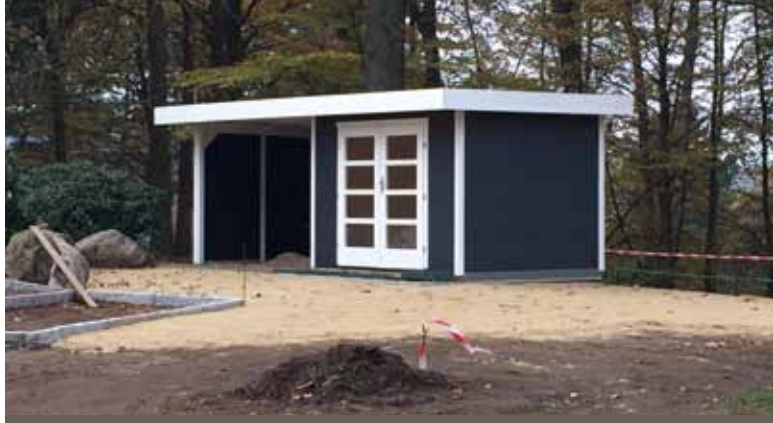
20 Baumaßnahmen Hockenberg