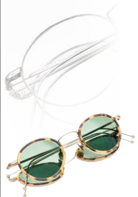
Campbell Modell 1002 Pure Titanium oder 18 Kt Weissgold

Hamburg Berlin Stuttgart New York Palm Beach www.campbell-optik.de Neuer Wall 18 20354 Hamburg