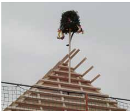
Richtfest im November

Unser Gastronomenpaar, Wiebke & Norbert Hobst, kann sich nach Abschluss aller Arbeiten über eine moderne Küche mit höheren Lagerkapazitäten, Sozialräumen, Büroraum und natürlich ein größeres Clubhaus freuen, in dem ihre Gäste nach einer erlebnisreichen Golfrunde regionale Spezialitäten genießen können. KD