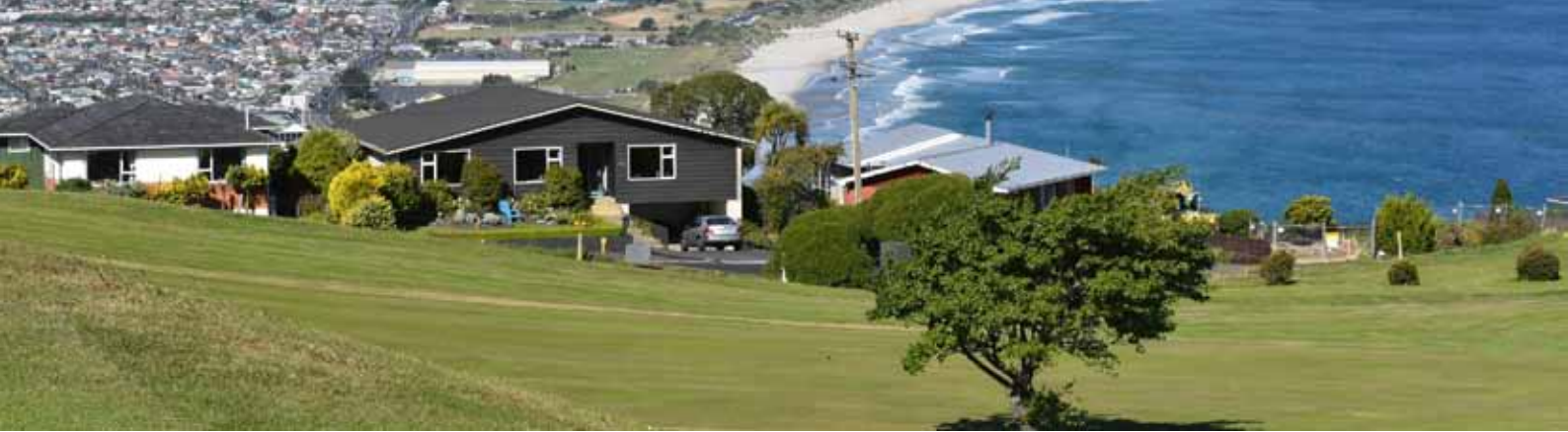
Blick vom 8. Tee des St. Clair GC auf die Stadt Dunedin und den Pazifik