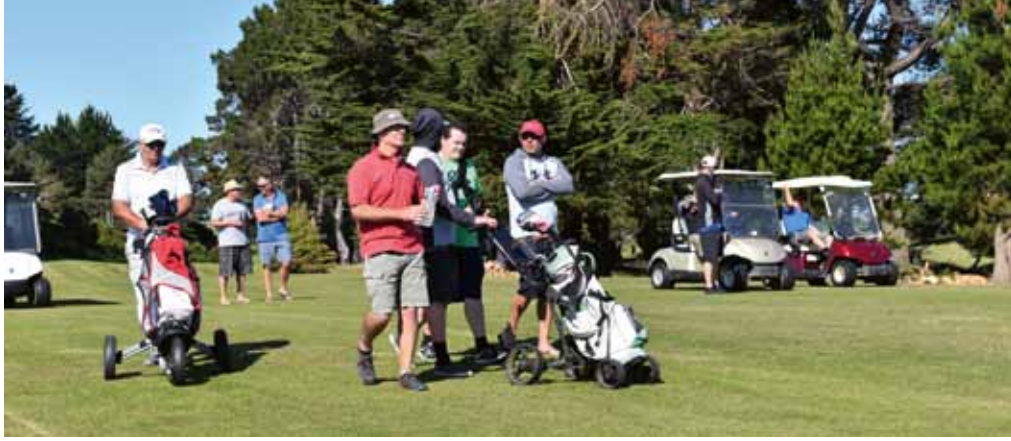
Die Spannung steigt auf Bahn 14. Spielern und Fans ist es anzusehen.

streichen. Nur so viel sei gesagt: Höchstgebote über 350 Dollar pro "Pferd" sind die Regel. Bietergruppen finden sich, die Sache ist ein Heidenspaß und der Druck auf die "Pferde" steigt mit jedem Gebot. Beim einige Wochen später stattfindenen Shootout sind dann natürlich alle da: Nicht nur die qualifizierten Spieler, sondern auch die "Jockeys" wollen nun ihre "Pferde" siegen sehen, geht es doch für den "Jockey" des Siegerpferdes um über 2.000 Dollar und auch für die Platzierten bleibt noch etwas übrig. Jeder Teil dieser Veranstaltung füllt Platz oder Clubhaus