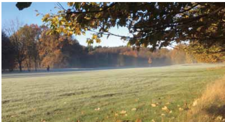
20 Herbststimmung in Holm