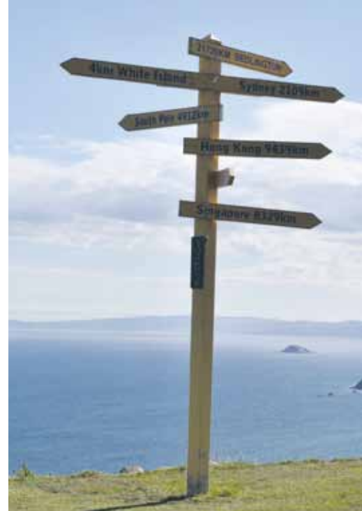
Spektakulärer Ausblick vom 15. Tee. Nicht immer strahlt die Sonne so im Edinburgh des Südens

Ich erinnere Jahreswertungen aus Deutschland, die dann mit einem "Preis der Sieger" endeten. In vielen Clubs sind diese Wertungen eingeschlafen, weil ihnen der nötige Pepp fehlt, zu kleine Gruppen angesprochen werden. Vielleicht ist diese Pferdewette ja eine Idee eine solche Jahreswertung mit richtig Schub zu verbinden, denn eines sei versprochen: Hier kann man Männer weinen sehen, hier