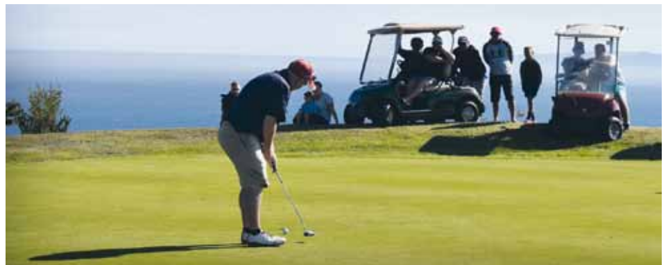
Knapp verpasst bedeutet in diesem Spiel schnell ausgeschieden.

Wenn es um so viel Geld geht, gibt es in Neuseeland auch immer noch eine Nebenwette. Wer gewinnt das Shootout? Hier kommt nun die Pferdewette ins Spiel. Die "Pferde" sind in diesem Fall unsere 10 Qualifikanten. Jedes Mitglied kann nun Lose in dieser "Calcutta" genannten Nebenwette erwerben. Ein Los kostet einen Dollar, verkauft wurden 1722 Lose.. Bei der schlauerweise mit einer "Happy Hour" im Clubhaus verbundenen Auslosung werden nun 10 Sieger gezogen, denen nun jeweils ein qualifizierter Spieler zugeteilt wird. Jedes "Pferd" hat also einen "Jockey" bekommen. Dem Jockey gehört das Pferd jedoch noch nicht, er hat nur ein "Vorkaufsrecht". Das Auditorium bietet nun auf jedes Pferd individuell, der Jockey hat die Möglichkeit durch Zahlung von 50 % des Höchstgebotes "im Sattel zu bleiben", oder das Pferd an den Höchstbietenden abzutreten und 50 % des Gebotes einzu-