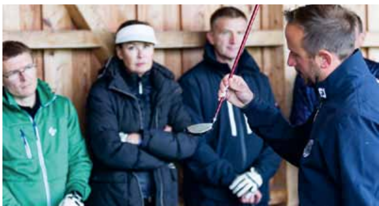
37 Golfsport aus Sicht der Medizin