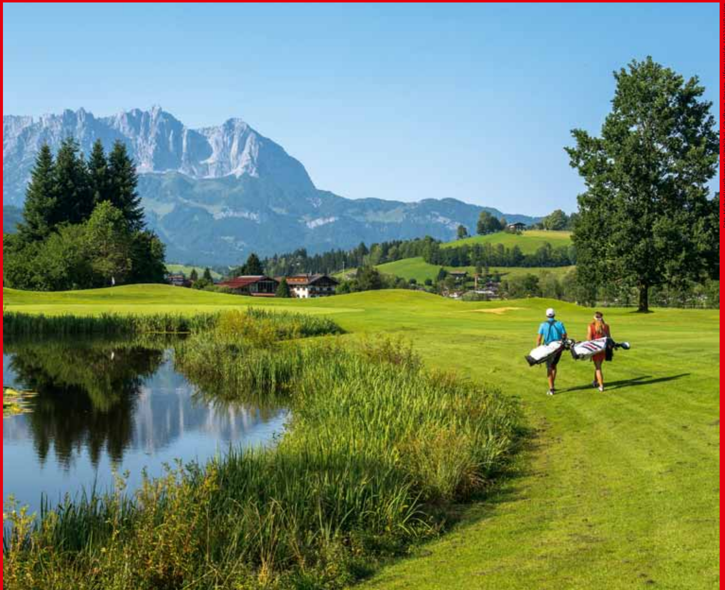
© Kitzbühel-Schriftzug-Design, Alfons Waide - 0933/WiVe Wien