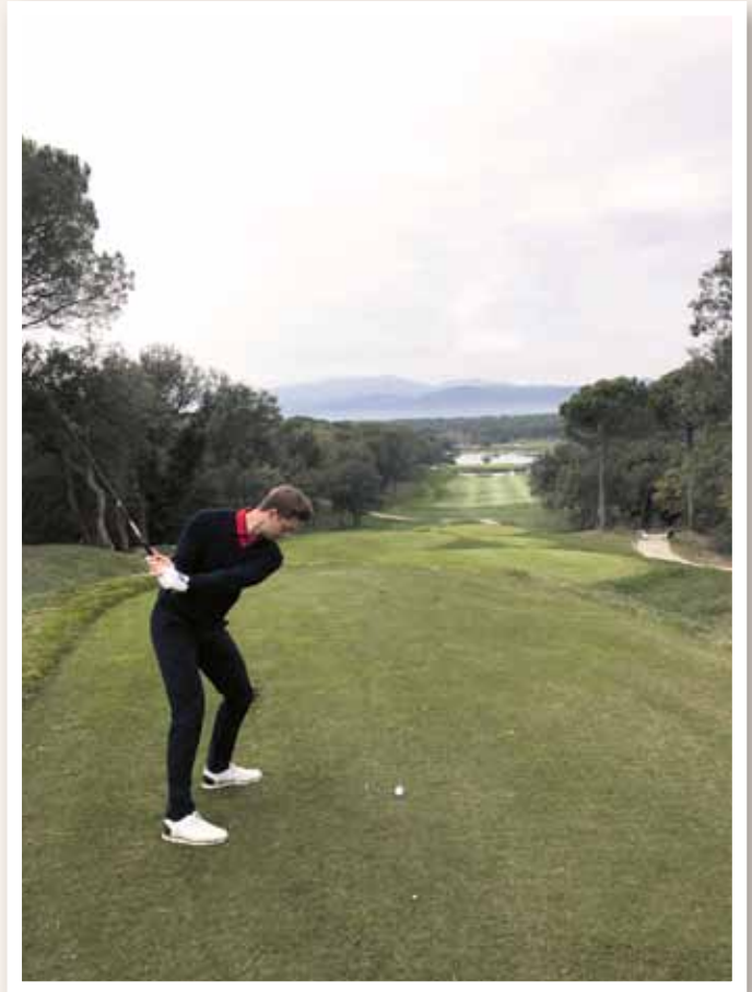
Optimale Bedingungen in Spanien